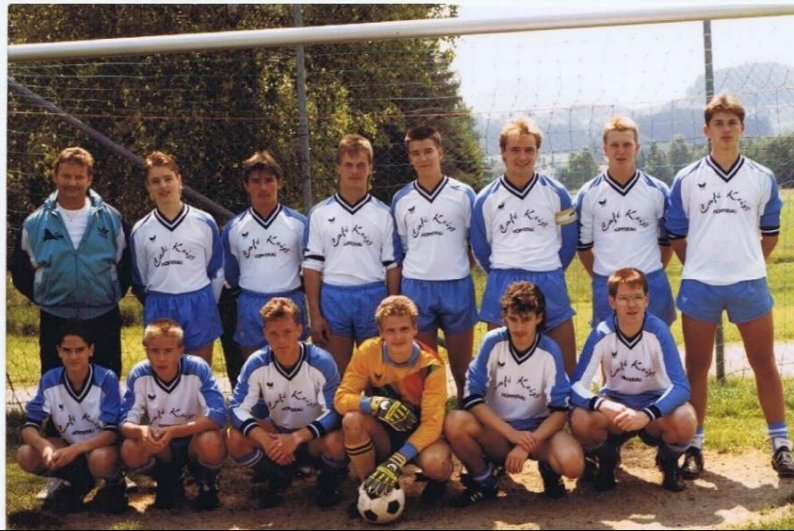
„Meisterschaft“ - im Spieljahr - 1983/84 "