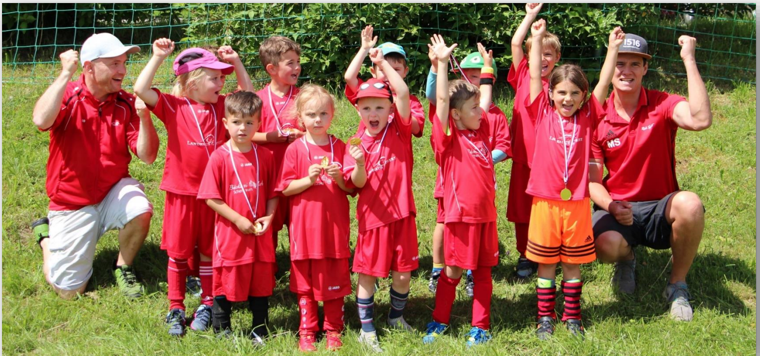
Auf den Fotos oben unsere Seeger Bambini (oben) und G1-Mannschaft (unten)