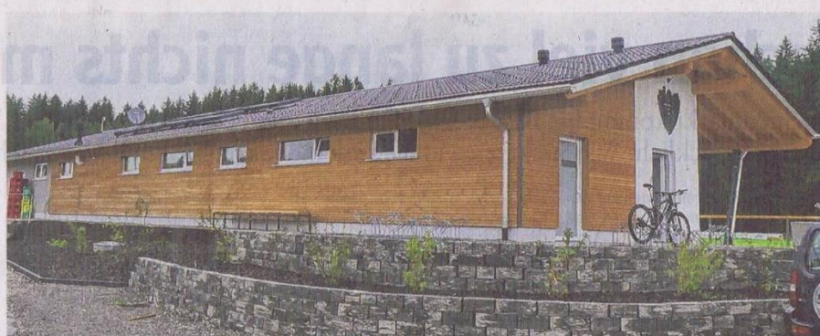
So sieht das neue Vereinsheim des TSV Seeg-Hopferau-Eisenberg in Unterreuten aus. Am Wochenende wurde es feierlich eingeweiht.

Fast genau vor einem Jahr wurde für den Neubau des alten Clubheims in Unterreuten gestimmt. Und nur ein Jahr später ist das neue Clubheim samt Außenanlage fertig. Wer hätte das gedacht – denn Corona machte einen dicken Strich durch die Rechnung. Laut Vorsitzendem Thomas Kaiser blieben die meisten Mitglieder dem Verein glücklicherweise treu. Auch die Sponsoren seien trotz angespannter Lage nicht weggebrochen. Am Ende standen